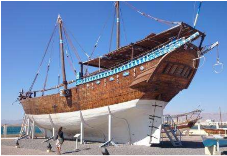
Fragt dhow bygget i 1965. Nu på museum i Sur

Omans 1700 km lange kyststrækning er velsignet med mange store og mindre naturhavne. Oman er også historisk set, først og fremmest, en søfartsnation, som indtil midten af 1800 tallet sejlede fragt med store dhows til Kina og det øvrige fjerne østen.