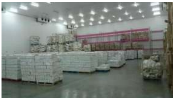
Foto 6 . OFC omsætter ca. 40.000 tons fisk/år hvoraf de 1000 t importeres (mest hajmallen som inderne vil have). Det er også en meget billig fisk og på hotellerne serverer man nu også denne pengasius (jeg fik den elendige fisk to gange). I dag eksporterer OFC og de 40 andre større og mindre firmaer i Oman fisk til 35 lande. Eksporten består næsten udelukkende af små pelagisk fisk som hele frosne sardiner, indisk makrel og den lange ribbon fish.

I 2011 blev alt trawlfiskeri forbudt i Oman, og trawlerne fik støtte til ombygning og nyt grej. Og senest er det også blevet svært at få licens til not - fiskeri. Jeg så flere større meget udtørrede og tilgroede (dvs. de ikke har været på havet i flere år) notbåde og trawlere som var lagt til kajen i flere havne.