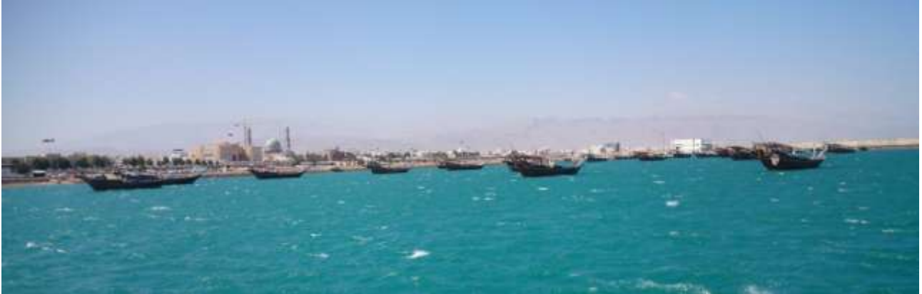
Fiske dhows i havnebyen Sur. 2014